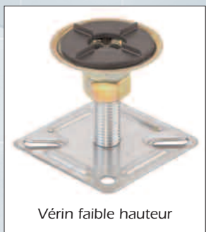
Vérin faible hauteur