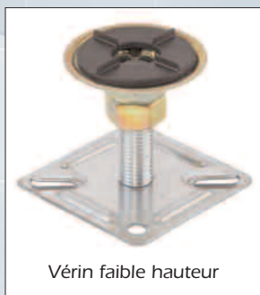
Vérin faible hauteur